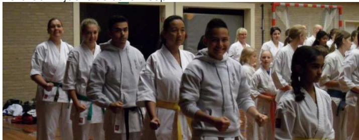
Katateam tijdens de Senshi-cup

De examens voor kyu-graden (ouderen en jeugd vanaf ca. 11/12/13 jaar) zijn eind november in Barendrecht.